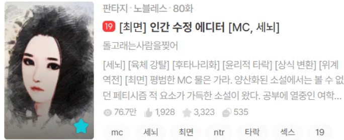
레몬빛돌고래 - 人类修改编辑器 (JOARA)

这部小说写得非常出色，我很想推荐给外国读者，但很遗憾，它只在韩国的付费小说网站上连载，无法直接分享。不过，我对“高洁的女性堕落”这一情节产生了强烈的罪恶快感，这促使我想创作一部类似题材的漫画。